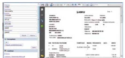
käyttäjän näkymä laskun hyväksyntävaiheesta